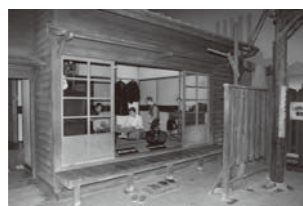
探究館の社宅(約50年前)