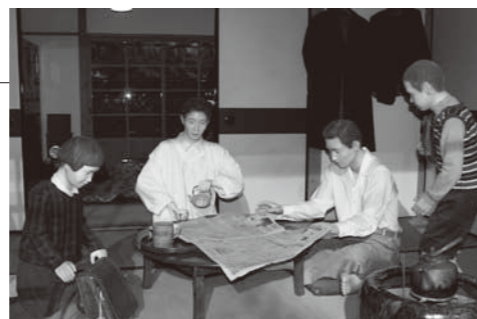
探究館（昭和30年代の社宅の生活）