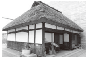
文化学習園の農家(約100年前)

事前に、ホームページで「文化学習園」を開くと、北九州に多く見られた農家(約100年前)が復元された様子を見ることができます。また、「探究館」を開くと、昭和30年代の八幡製鐵所社宅(約50年前)が再現され、そこで暮らす家族の様子が紹介されています。昔の道具や生活の様子で、調べたいことを考える学習問題づくりのきっかけを得ることができます。