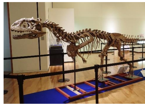
マジュンガサウルス 中生代白亜紀後期のマダガスカルにいた肉食恐竜のレプリカ