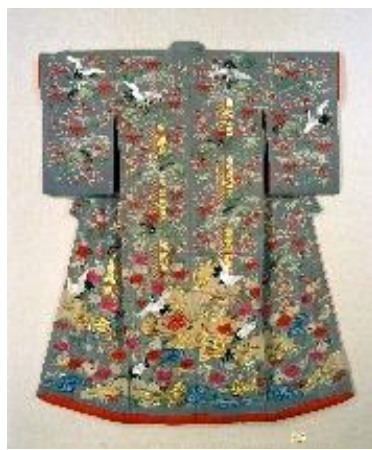
縮緬地松竹梅鶴亀模様打ち掛け 19~20世紀 館蔵(堀切コレクション)