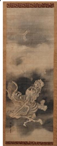
龍図 狩野安信筆 17世紀 福聚寺蔵