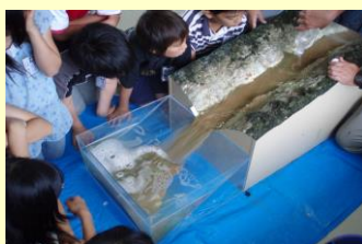
川の模型 (ジオラマ)