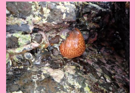
マンジュウボヤ (尾索動物)