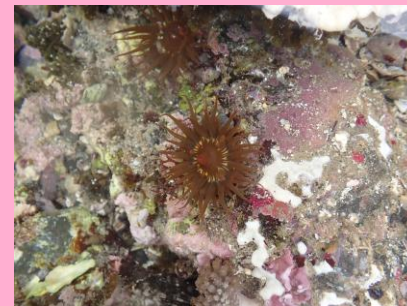
なかま イソギンチャクの仲間 (刺胞動物)

ちきゅうじょう たよう せいぶつ せいそく ちゅうがっこうりか きょうかしよ ひら せいぶつ 地球上には多様な生物が生息しています。中学校理科の教科書を開いてみると、「生物 せきつどうぶつ むせきつどうぶつ くべつ せきつどうぶつ ほにゆうるい ちようるい はちゆうるい りようせいりい ぎよるい は脊椎動物と無脊椎動物に区別され、脊椎動物は哺乳類、鳥類、爬虫類、両生類、魚類のグ ループに分けられる。」とあります。一方、無脊椎動物は、具体的なグループのリストはなく 「脊椎動物に比べてはるかに多くの種類があり…(後略)」と述べられるに留まっています。 せきつどうぶつ くら おお しゆるい こうりやく の とど 「脊椎動物に比べてはるかに多くの種類があり…(後略)」と述べられるに留まっています。 もう少し細かく教科書を読んでみると、無脊椎動物の代表的な生き物として、節足動物が挙 げられており、節足動物には甲殻類(ザリガニやエビ、カニ)や昆虫類(バッタやチョウ)、ク モ類(クモやサソリ)、ムカデ類、ヤスデ類が挙げられています。また軟体動物も紹介されてい るい るい るい あ なんたいどうぶつ しょうかい て、二枚貝や巻貝、イカ・タコの記述があります。しかし無脊椎動物には節足動物と軟体動物 いがい 以外にもたくさんのグループが含まれます。例えば、岩場の影にひっそりと住んでいるホヤ びさくどうぶつ かいめんどうぶつ いんぎんチャク(刺胞動物)、優雅に海をただようヒラム シ(扁形動物)やクラゲ(有櫛動物)、海の掃除屋ヒトデ(棘皮動物)、干潟を掘ると見つかる ギボシムシ(半索動物)など、まだまだたくさんのグループがありますが、スペースが足りなく なってきたのでこのあたりで止めておきます。もりや川、うみに じっさい て い も の さが 教科書に載っていない生き物に出会うことができます。