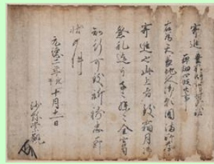
むとうすつかんきんしんじょう 武藤崇観寄進状