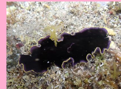
なかま ヒラムシの仲間 (扁形動物)