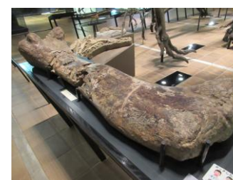
アパトサウルスの大腿骨

博物館では、見学を楽しんでいただけるように、実際に触れたり体験したりできるコーナーを設けています。見たり触れたりして、感じたことや気づいたことを子どもたちと一緒に話しながら館内を楽しんでください。