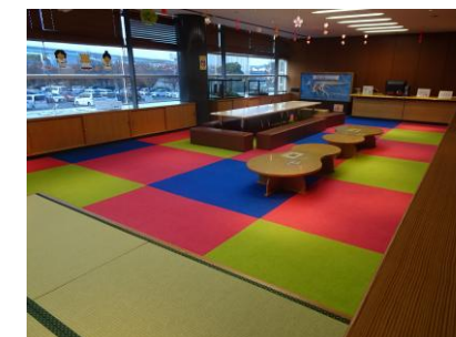
子どもミュージアム