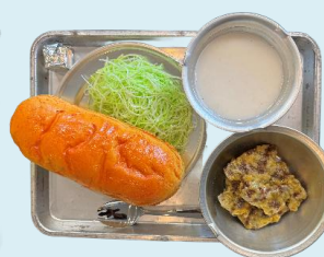
くじら・脱脂粉乳